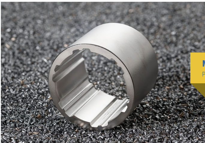
Jedes Wunschprofil ist möglich. Linearführungsbuchse mit Doppelnuten.