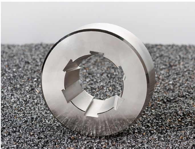
Profil mit T-Nuten. Sonderbauteil für Hydraulikschläuche.